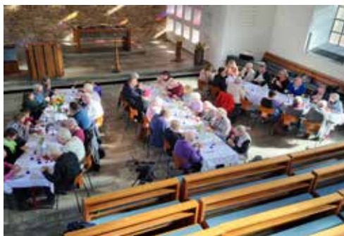
Die Festtafel mit den Gästen