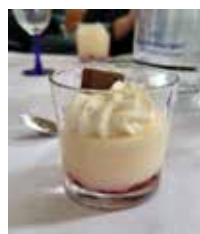
Der erste und vierte Gang des Menüs