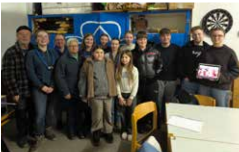
Bei der Mitgliederversammlung