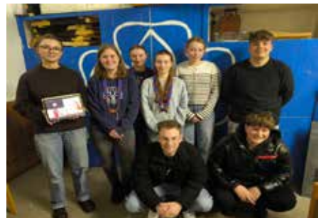
Die Mitarbeitenden-Runde