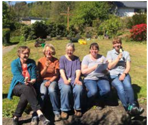
Die fleißigen ehrenamtlichen Helfer