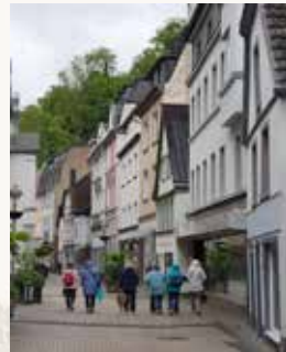
Spaziergang durch Altena