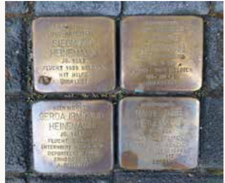
Stolpersteine in Altena