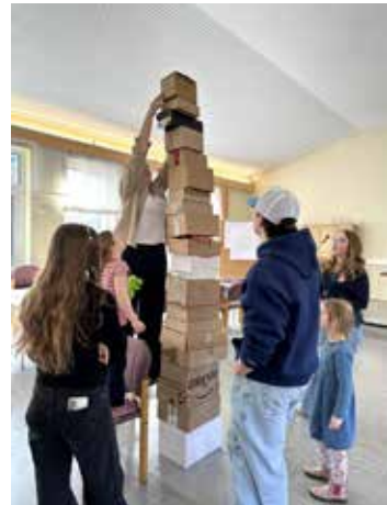
Der selbstgebaute Turm reichte bis zu Saaldecke