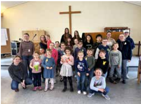
Alle kleinen und großen Teilnehmer, sowie Durchführende, der Kinderkirche.