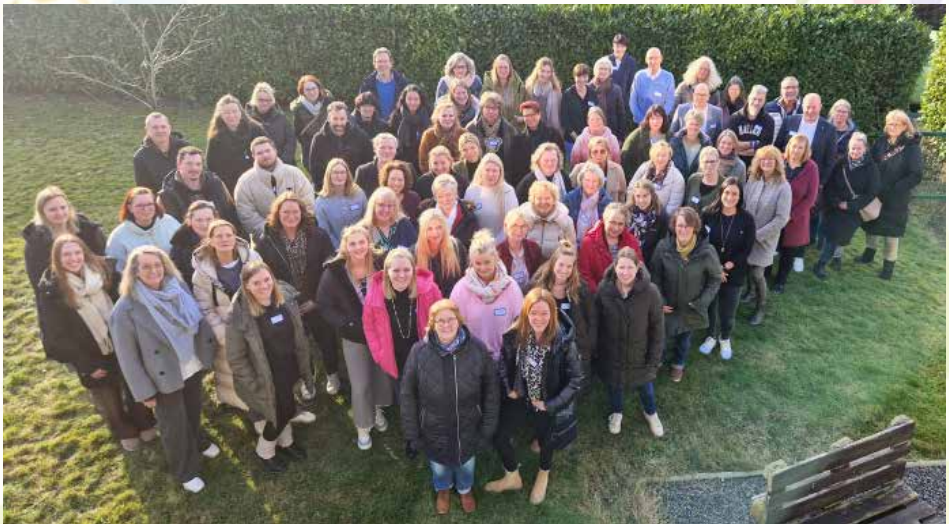
Beim ersten gemeinsamen Treffen aller Leitungen der rund 59 Kindertageseinrichtungen kamen die Verantwortlichen zusammen, um sich über den aktuellen Projektstand auszutauschen und die zukünftige Ausgestaltung der neuen Trägergesellschaft gemeinsam voranzubringen.